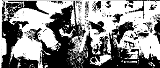
Actores disfrazados de Quijote y Sancho, en el diálogo sobre turismo.

Según los últimos datos de la OMT, este año el turismo internacional puede registrar un incremento de entre el 5% y el 9% de llegadas en el mundo, con una clara recupera-